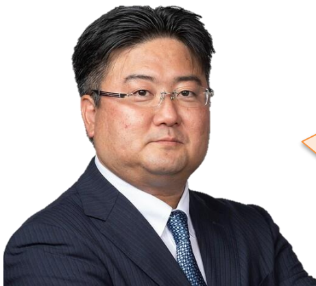
ソフトクリエイトホールディングス マンスリー・ニュース編集長 (取締役 常務執行役員)