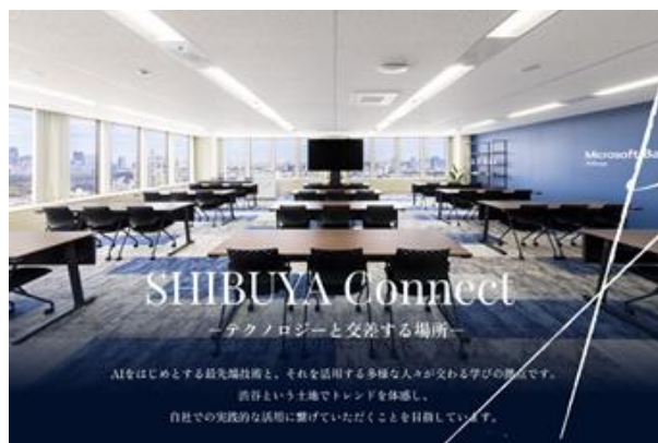
渋谷発、最先端技術と交流の拠点『Microsoft Base Shibuya』

日本マイクロソフトがパートナー企業を対象に、優れた実績をおさめた企業を選出するプログラムです。2021年のグローバルアワードファイナリストを含めて、ソフトクリエイトは 7年連続の受賞 となります。