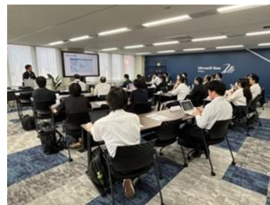
実機で最新技術を体感し、現場で役立つヒントが得られるワークショップを定期開催